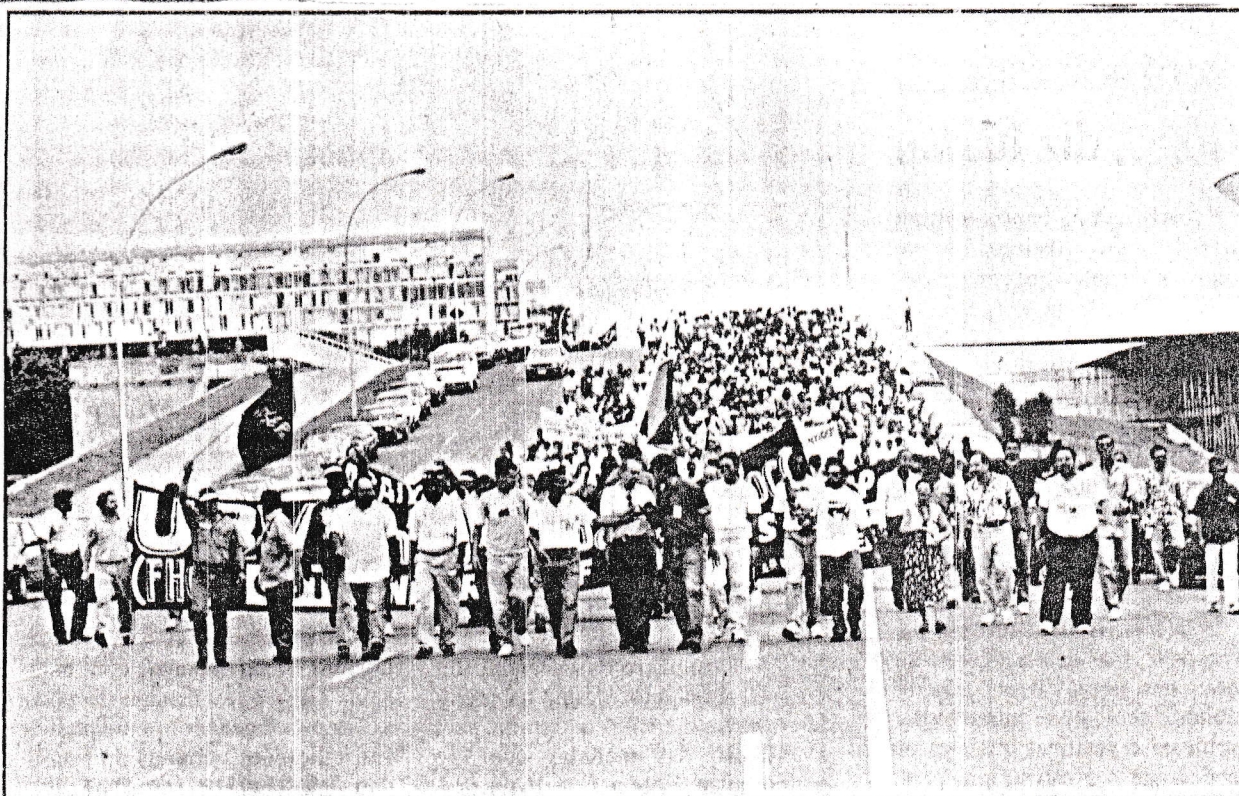
Segundo o Sindprev, cinco mil servidores participaram ontem de passeata na Esplanada dos Ministérios